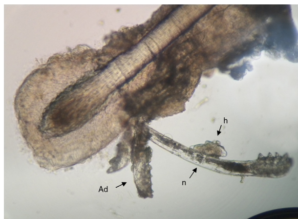
Figura 2 Demodex y morfotipos de su ciclo biológico observados en pestaña de paciente con DEBS. Pestaña parasitada con adulto (Ad), huevo (h) y ninfa (n) de D. folliculorum , 400 \times .

La relación entre la presencia de distintas especies de Demodex y de patología ocular, a su vez asociada a otras variables (como sexo, edad e InI), se indica en la tabla 1 . Se pudieron identificar asociaciones significativas entre la presencia de Demodex spp. y los pacientes mayores de 60 años ( p<0,001 ), como así también entre la presencia de Demodex spp. y pacientes con ojo seco, con blefaritis o con ambos ( p<0,001 ). En cambio, no se detectó relación significativa entre la presencia del ácaro y otras patologías (conjuntivitis, glaucoma, seborrea, cirugía de cataratas, chalazión), tampoco con el sexo de los pacientes. Sin embargo, resultó llamativo que aquellos pacientes con \text{InI}>0,5 presentaron infecciones con sintomatología más marcada (comezón, ojo seco, blefaritis